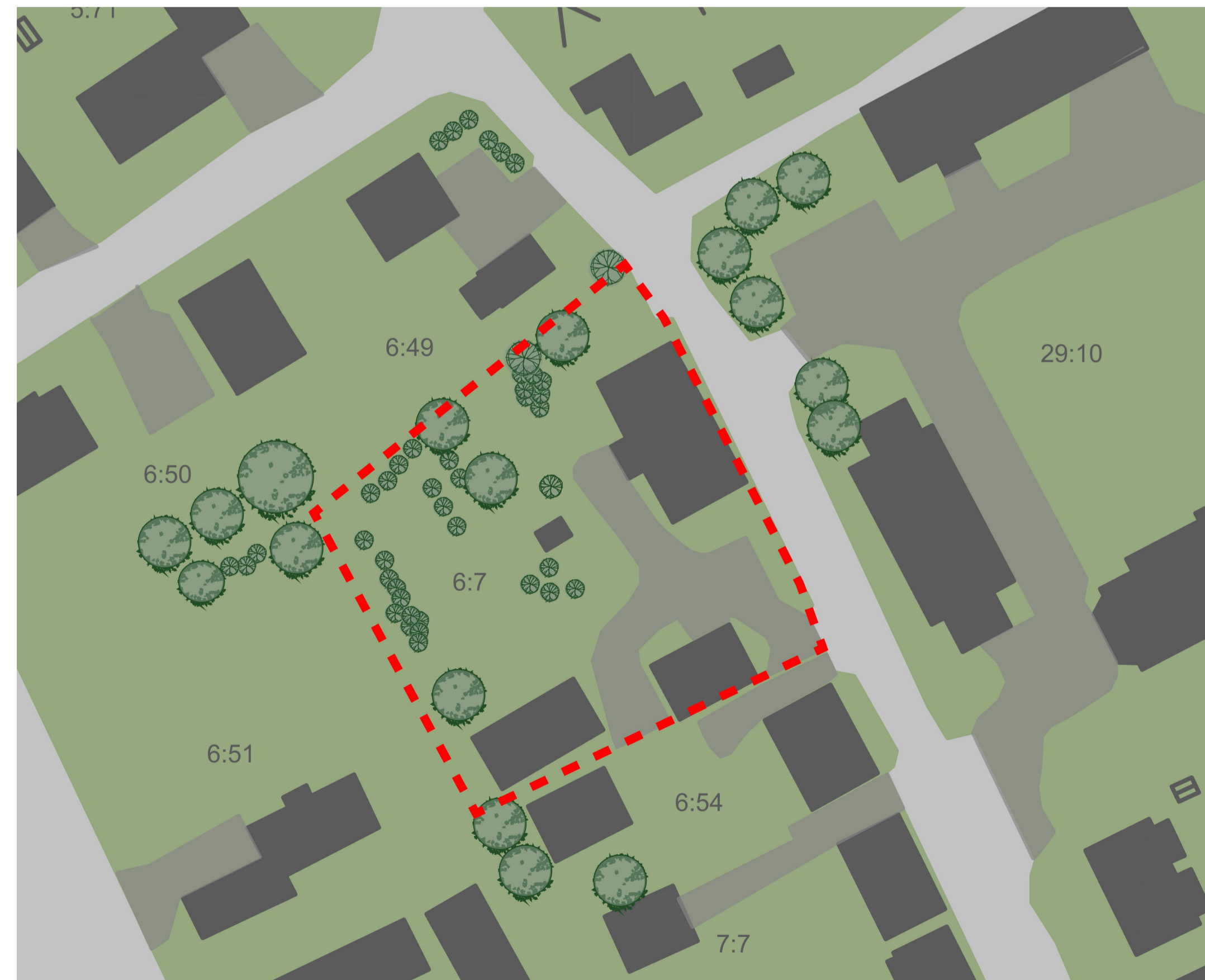
ILLUSTRATION (ej skalenlig)