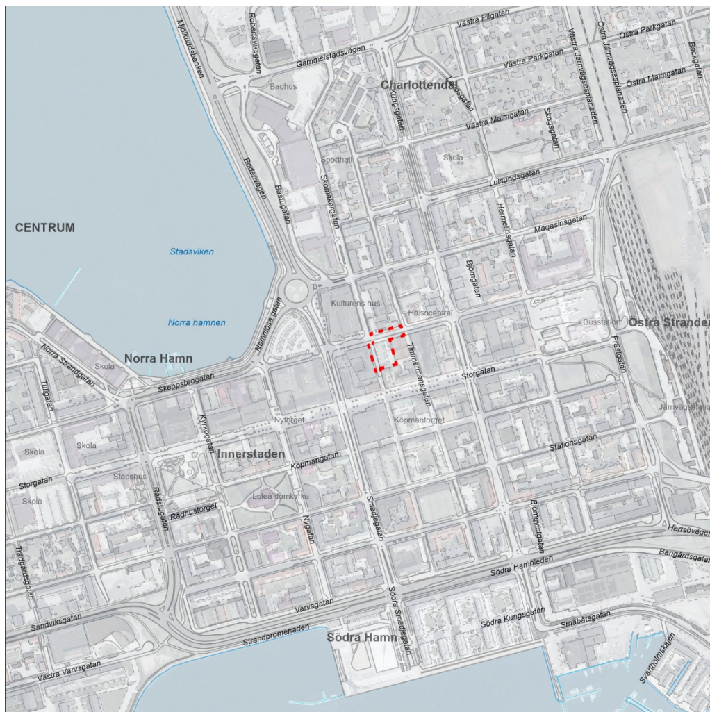
Figur 1: Översiktskarta där fastigheten Katten 6 är markerat i rött

Kommunstyrelsens arbetsutskott beslutade 2021-04-26, § 74 att ge stadsbyggnadsnämnden i uppdrag att upprätta förslag till ny detaljplan och tillhörande gestaltungsprogram för del av Katten 6, i syfte att pröva förutsättningarna för bostäder och verksamheter.