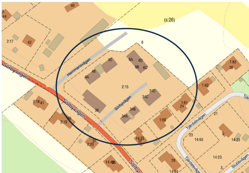
Kartbild över området som markanvisningen gäller

Överlåtelse kan ske genom försäljning eller upplåtelse med tomträtt. Priset baserar sig på ett marknadspris i området och fastställs vid tid för överlåtelsen. Val av upplåtelseform fastställs i kommande avtal.